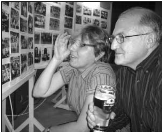
Součástí příjemného večera byla i menší výstava školních fotografií napříč dobou.