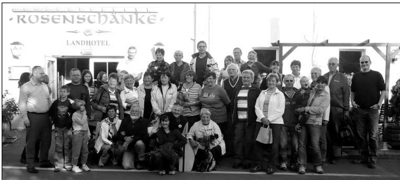
Kompletní česko-německá turistická skupina Wandertagu.