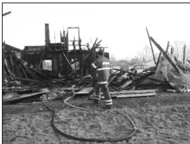
Torzo nedostavěného domu v ulici Ke Knížáku po požáru 27. listopadu 2010. Naštěstí nedošlo k žádným újmám na zdraví.