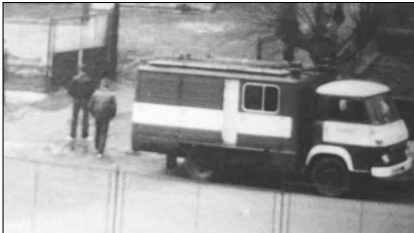
Nové požární vozidlo hasičského sboru v Háji AVIA při výpomoci zásobování.

● Národní výbor začal v r. 1970 po dohodě s vlastníky domů od č.p. 97 až po č.p. 104 budovat v akci „Z“ chodník, který v této části Kubátovi ulice chyběl. Vlastníci dvou domů částečně posunuli své ploty od silnice k uvolnění plochy pro chodník. Dva vlastníci domů, č.p. 207 a č.p. 100, tak přišli o své předzahrádky. Národní výbor těmto vlastníkům přispěl po dohodě materiálem na obnovení posunutého oplotení. Stavbu