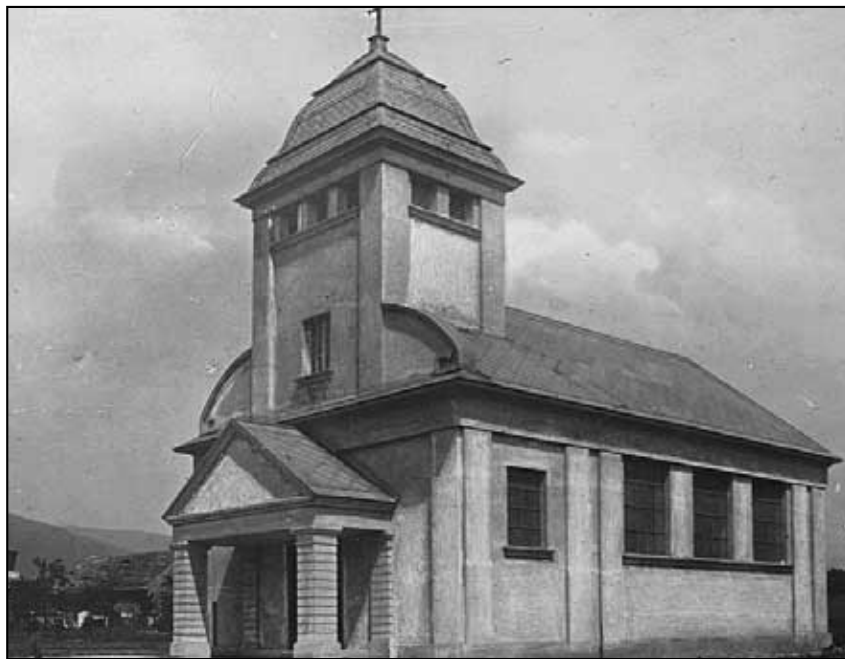
V roce 1975 byla provedena demolice kaple.