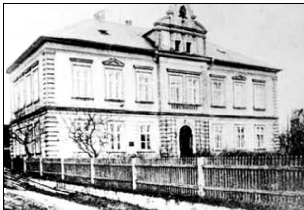
Základní škola v Háji u Duchcova.

Razítko Správy obecné školy Jana Zelenky (vlevo).