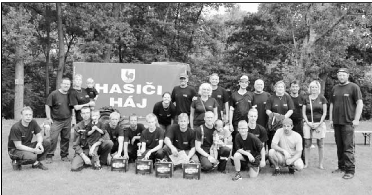
Společná fotka po závodech Tohatsu fire cup 2015 v Háji u Duchcova 25.7.

1. srpna 2015 Měrunice 7. kolo - Tentokrát jsme sem šli s menší představou, jak to vypadá na těchto závodech. Nicméně jsme měli oproti minulému kolu zásadně změněnou sestavu - oproti minulému závodu zde byl jiný koš, strojník béčkař a jeden proudař. První se běžel útok Top na 3xB. A co se nestalo? Podařilo se nám zaběhnout náš nový osobní (týmový) rekord , a to čas 27:73. Druhý se běžel útok Říp na 2xB. Nicméně se objevil menší problém u rozdělovače. I přes komplikace jsme ale útok řádně dodělali, i když s o dost horším časem. V kategorii na 3xB TOP se Háj umístil na 10. místě . V kategorii na 2xB ŘÍP se Háj umístil na 9. místě .