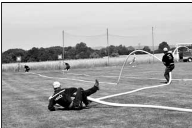
Požární útok mužů z Háje na závodech Podřipské ligy v Měrunicích 1.8., kde můžete vidět, že závodění není žádný med