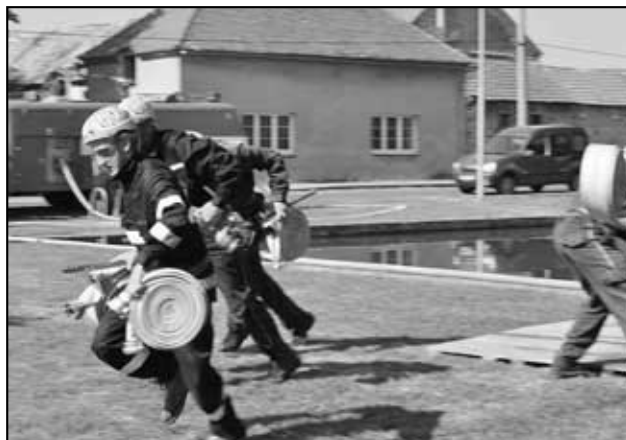
Muži z Háj A si běží pro 1. místo na závodech ve Lkáňi