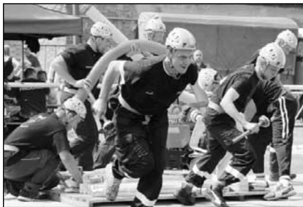
Požární útok Háj muži na závodech v Čermuci 18.7.