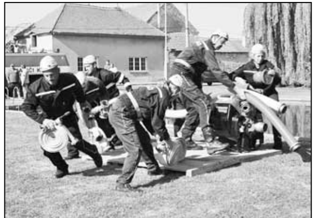
Družstvo Háj B na závodech Tohatsu fire cup 2015 ve Lkáni 8.8. - 3. Místo

27. června 2015 Srstice - Požární útok přípravky z Háje byl... no trochu chaotický. Jeden závodník běžel na jiné místo, než mu bylo určeno, čímž rozhodil ostatní závodníky, a tak každý byl jinde, než měl být. I bez přímého zásahu vedoucích (pouze s mluvenou pomocí) dokázalo hadice dostat k nástříkové čáře a po jisté době i úspěšně nastříkat, i když s horším časem. Každý den není posvícení. Někdy se daří a někdy ne. A právě tento den se pro změnu dařilo našim mladším žákům. U této kategorie se vše pilovalo a ladilo. Zlepšili jsme trochu systém, na startu byli naši věkově mladší závodníci. Ovšem i přes svou zdánlivou nevýhodu věku byl požární útok naprosto perfektní, dokonce velmi rychlý. Trenérům to udělalo velkou radost, stejně jako tak dětem samotným. Opravdu perfektní výkon, na který jsme dlouho... dlouho a velmi dlouho v kategorii mladších čekali. Úžasný! Háji v kategorii mladších vyhrál zasloužené 2. místo, a to v konkurenci 11ti družstev. A dokonce jsme byli ve vteřině s prvním místem a co víc, dali jsme velmi pěkný čas - 20 vteřin. Skvělé a jen tak dál.