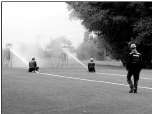
Nástřik terčů družstva Háj B na závodech v Háji u Duchcova 25.7. - 3. Místo