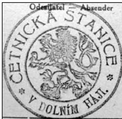
Razítko četnické stanice v Dolní Háji

Zločin nejtěžší aneb vražda. Případ vraždy byl podle poznámek památníku na sledovaném území řešen pouze jednou, v květnu 1926 byla v lokalitě Hofjägerberg, v lese nad Horním Hájem na úpatí Stropníku, kolemjdoucími železničáři náhodně objevena mrtvola zastřelené „neznámé ženštiny, jejíž hlava a trup byly za-