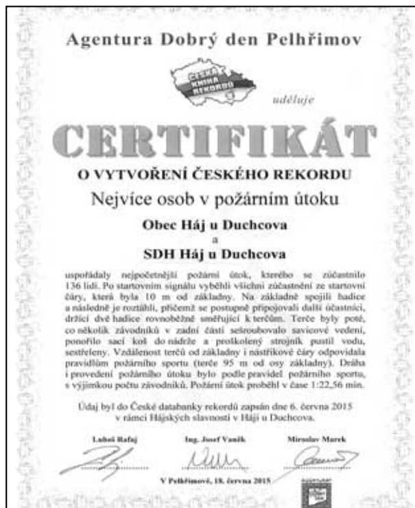
Rekord našich hasičů je zapsán v České knize rekordů