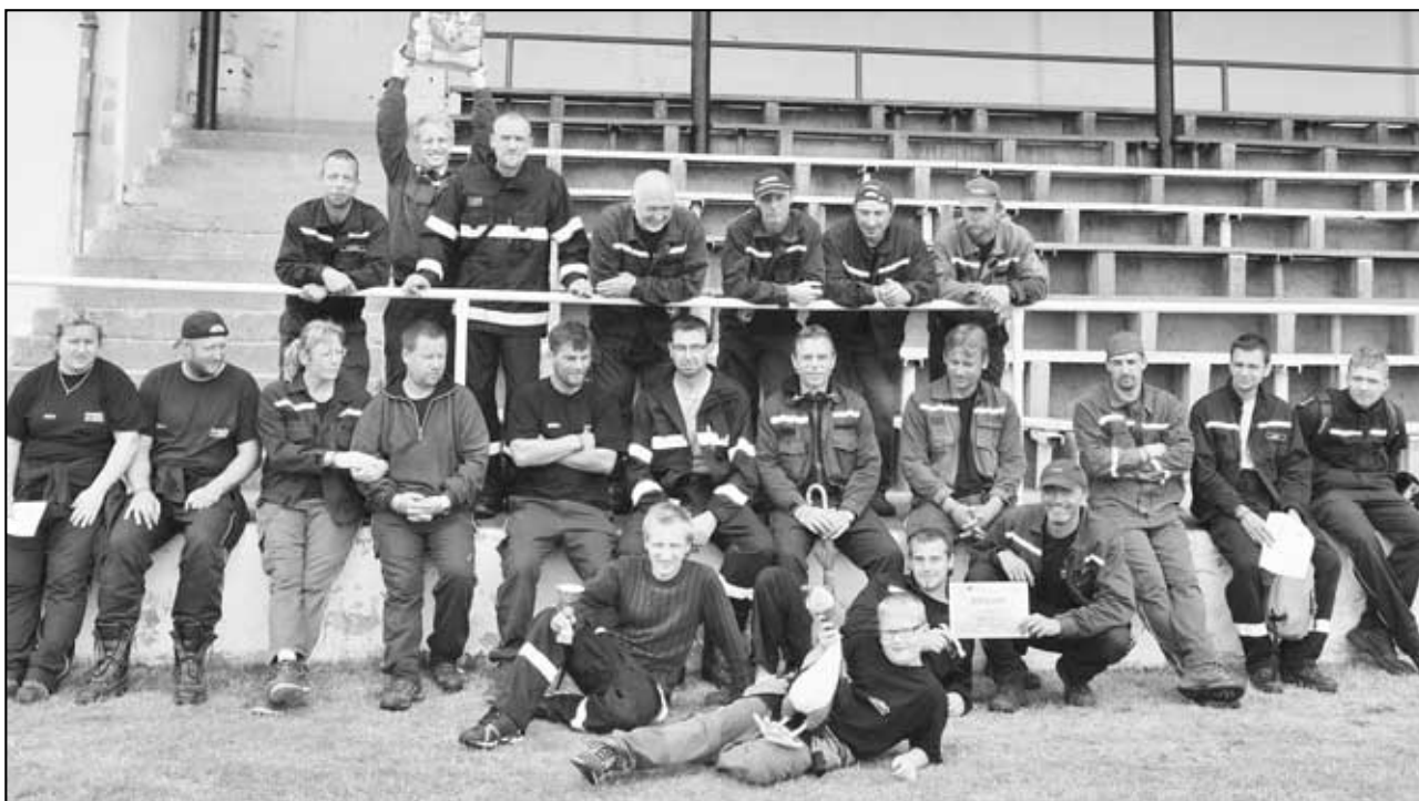
I po Hájských slavnostech jsme druhý den fungovali zcela na plno a dokonce i vyhrávali