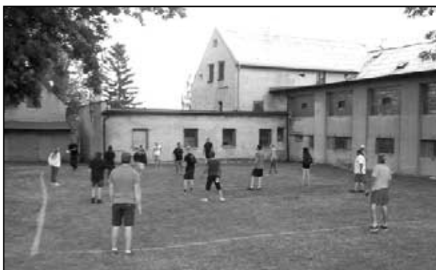
Zábava u hasičů nechybí - po závodech v Hájí si asi dvacítku lidí zahrála několik turnajů ve vybíjené