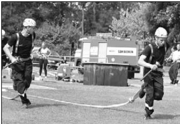
Požární útok mužů z Háje na Podřipské lize v Předoníně