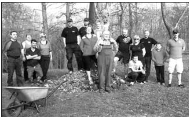
Hasiči z Háje v jarních měsících absolvovali několik brigád v řádu desítek hodin na novém travnatém hřišti

4. července 2015 Noční závody Štrbice - Zhruba po dvou letech se hájští vrátili na noční závody do Štrbic, a to dokonce jako závodníci. Bylo postaveno jedno družstvo mužů. Samotný požární útok se nám nepovedl. Vlastně jsme ho nedokončili. Vyskytlo se několik problémů, zejména u rozdělovače. I když jsme útok nedokončili, nebyla to žádná velká tragédie. Pro vítězství jsme si tento rok ještě nejeli (to až příští rok), letos jsme se jeli hlavně zúčastnit, podívat a otrkat nováčky. Útěchou nám může být smutný fakt, že na letošním ročníku nočních závodů se přímo roztrhl pytel s nedokončenými útoky. V kategorii mužů rovnou šest družstev z 19 nedokončilo útok. Z celkových 19ti družstev se Háj muži umístil