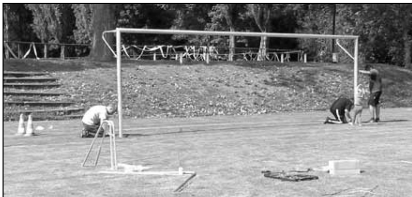
Montáž nových branek na spodním hřišti