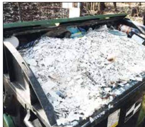
Domaslavice – kontejner naplněn stavební sutí...