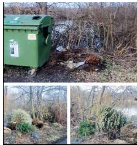
Okružní ul. – okolí kontejneru na sklo