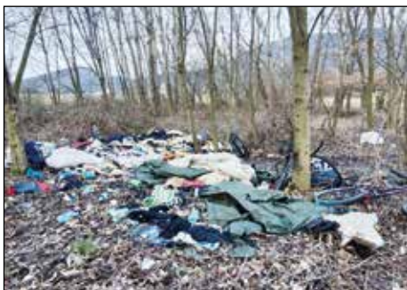
Cesta od Kapličky směr Osek, černá skládka ještě na katastru obce

Obrázek toho, co bude obec nucena činit dál, si asi umíte udělat každý sám. Pokud tedy nechceme, aby prostředky, které můžeme a chceme vydávat za investice do budování chodníků, cest, veřejných prostranství, dětských hřišť a dalšího byly používány na úhradu stále rostoucích nákladů na likvidaci odpadu. Třídít a chovat se zodpovědně musíme všichni. A umět chovat se ohleduplně bychom měli také... Irena PIPIŠKOVÁ