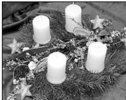
Adventní věnec se stal i v dnešní době trendem na každém vánočním stole

nou do Jeruzaléma. Štěpán je národním patronem Uher, místně uctíván jako patron koní a vinné révy.