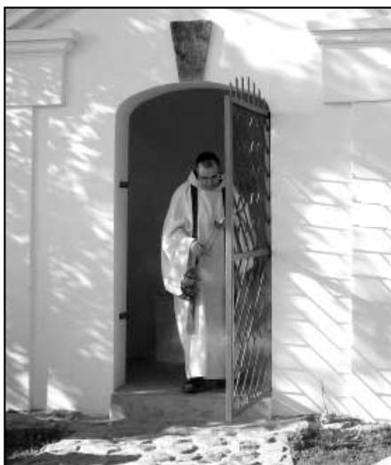
Světící kněz Charbel při liturgii