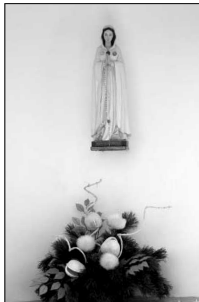
Santa Maria Rosa Mystica v hájské kapličce