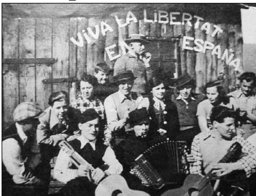
Poznáte-li někoho z nich, dejte nám vědět pro zápis do kroniky