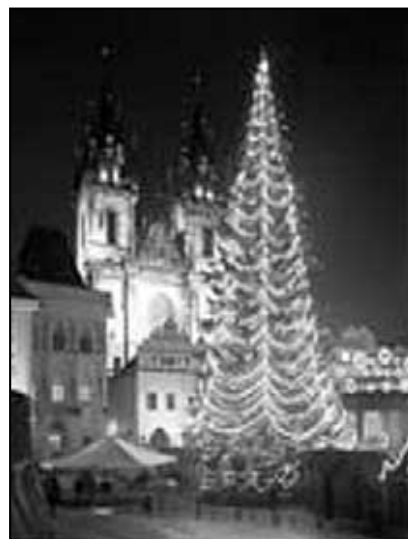
I letos se na pražském Staroměstském náměstí blýskne vánoční strom

lévek, mezi nimiž nechyběla bramboračka a rybí polévka, pekl se kuba z krup a česneku. Mezitím co se hospodyně snažila v kuchyni zabavit děti, přinesl v některých krajích hospodář tajně stromeček a ustrojil ho do slavnostního hávu. Jinde se stavěly betlémy. Lidé se od rána postili, aby večer uviděli „zlaté prasátko“. S přicházejícím soumrakem děti stále častěji vybíhaly ven, pozorovaly nebe a hlídaly, kdy se objeví první hvězdička. S první hvězdou si rodina sedla k slavnostnímu stolu prostřenému bílým ubrusem. Večeři zahajovala společná modlitba, vzpomínka na uplynulý rok a poděkování Bohu za vše dobré, co přinesl, i za to, co vzal. Nejdříve hospodyně postavila na stůl mísu s hrachem. Klíček hrachu má podobu kalichu a podle tradice spojoval všechny stolovníky v dobrém i zlém. Potom paní domu odebrala z mísy po lžici pro každé z domácích zvířat. Teprve pak si podle vážnosti a stáří nabírali ostatní. Po hrachu se podávaly polévky pro sílu, čočka, aby byly peníze, kuba, masitý pokrm nebo ryba pro radost. Kostí se dávaly na jeden talíř a po večeři je hospodář odnesl ve lněném ubrousku pod jabloň. Naposledy se na stole objevila vánočka a cukroví. Pila se bílá káva, čaj, nechybělo ani trochu piva, vína nebo hlt pálenky pro dobré zažití. Když zazvonil zvoneček, přinesl hospodář do místnosti stromeček ověšený jablíčky, sušeným ovocem, cukrovím, kostkami cukru zabalеныmi do barevných papírků, ořechy a řetězy. Na stromečku se zapálily svíčky a všichni (Pokračování na str. 7)