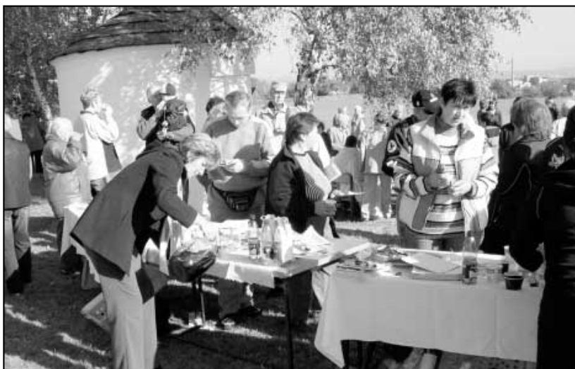
Zážitek ze svěcení si nenechali ujít mnozí hájští občané.