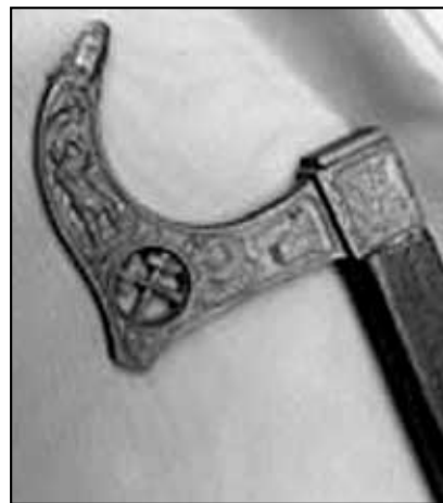
Vycházková hornická hůl z roku 1885