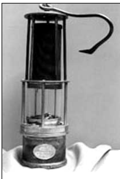
Benzínová lampa firmy Koch kolem roku 1910

Nevalným mezníkem pro obec byl rok 1963, kdy Krajským národním výborem, Okresním národním výborem a Obvodním báňským úřadem v Mostě byl schválen likvidační záměr obce Háji u Duchcova z důvodu důlní činnosti a 3. června 1963 odborem výstavby Okresního národního výboru v Teplicích vyhlášena stavební uzávěra obce pro trvalé omezení stavební činnosti v obci Háji u Duchcova, s účinností likvidace obce rokem 1964 po etapách. Plán likvidace obce hovoří o započetí demolice domů v horní části obce těsně pod osadou Domaslavice, kde jako první bude v r. 1964 zbourán obytný dům čp. 3 v Domaslavicích. Dolování bude pokračovat jižním směrem od silnice Hrob - Osek, kde budou v témže roce v Háji zbourány 4 domy. V roce 1965 bude v jižním směru zbouráno 10 domů, v r. 1966 zbouráno 23 domů. V r. 1968 mělo být zbouráno 25 domů vč. hořejší školy čp. 141. V r. 1969 zbouráno 5 domů, v r. 1970 to mělo být 5 domů a v r. 1971 12 domů. V r. 1973 mělo být zbouráno celkem 18 objektů vč. dolní školy čp. 122. Zbývajících 107 domů vč. budovy Místního národního výboru čp. 155, pošty čp. 31, obchodů a budov Státních statků mělo být likvidováno postupně do r. 1984. Protože v r. 1974 mělo dojít k likvidaci centra s úřadovnou MNV, školy, pošty a obchodů, bylo navrženo provést celkovou likvidaci obce již v roce 1974.