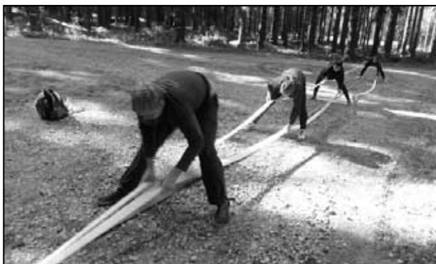
Hájský tým plete z hadic cop - zde je důležitá sebranost a komunikace celého týmu