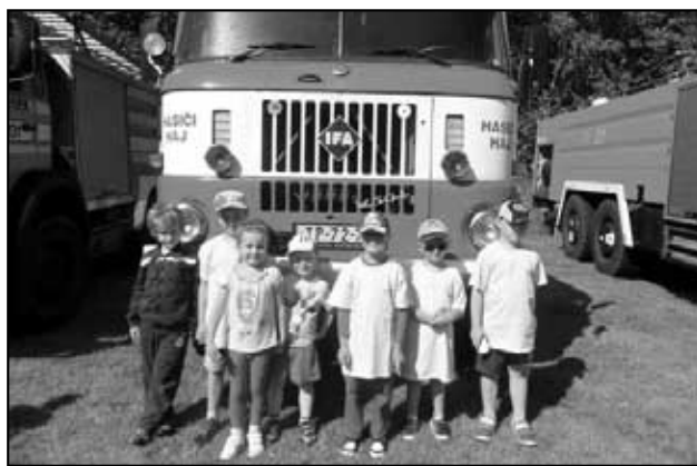
Hájští na závodech v Košťanech