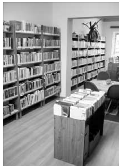
Obecní knihovna nově vymalována

Na shledání se těší Karel Singer , knihovník