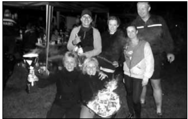
Vítězné družstvo Háj ženy na Nočních závodech ve Štrbicích

komornější atmosféra, a tak bylo jasné, že soutěž bude probíhat opravdu rychle. Na naši přípravku čekaly dvě disciplíny: štafeta 4x60m a požární útok. Štafetu naši Soptíci zvládli přímo ukázkově a oba dva jejich pokusy byly uznány za platné. Jde tedy vidět, že i tuto náročnou disciplínu zvládají bezproblémově, byť některé její části jsou pro ně opravdu náročné. Během samotného požárního útoku se vyskytly malé komplikace, ovšem nic vážného a náš pokus byl úspěšný. Ještě před samotným vyhlášením výsledků zde byla ukázka vyprošťování osob z havarovaného vozidla v poddání HZS Teplice. Kromě toho zde bylo pro děti připraveno několik atrakcí, jako například skákací hrady, el. čtyřkolky, malování na obličej apod. Vyhlášení výsledků nebylo vůbec napí-