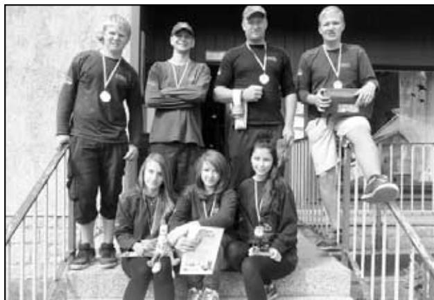
Háj u Duchcova 2. místo na Euroregionu Krušnohoří 2013

Neděle, poslední den, bývá ve znamení uklízení, balení, loučení ale hlavně nervozity, jelikož jsou všichni zvědaví na slavnostní nástup. U celého družstva i u trenérů dosáhla míra nervozity tak vysokého stupně, že by nejenom dosáhla nejvyšší stupnice měřitelných hodnot, ale ještě bychom jí mohly vyvážet do celého světa. Z celkových 16 družstev jsou výsledky takové: 1. místo Bílenec 1 (98 trestných bodů), 2. místo Háj (111 trestných bodů), 3. místo Cítoliby (119 trestných bodů), 4. místo Niederbobritzsch 1 - 127 (zbytek výsledků je uvedeno na našich webových stránkách). Naše družstvo se tak umístilo na krásném 2. místě, přičemž svou vlastní medaili obdržel i náš Kohout Bob, kterého si během předchozího společenského večera zamiloval i jeden z hlavních německých organizátorů. Letos jsme s našimi výkony mohli být vcelku spokojeni, družstvo se snažilo a mělo správný zápal i nasazení, ovšem bohužel tým Bílence byl letos lepší, a tak první místo patří zaslouženě jim, k čemuž jim gratulujeme. Víkend jsme si naplno užili, domů jsme si vezli řadu