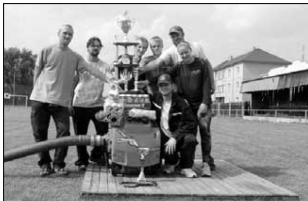
Dream team Háj muži na závodech v Hostomicích vyhráli 1. místo a obří pohár

Na tyto závody se popravdě řečeno náš tým vydal trochu na rychlo a bez tréninku. Vše vzniklo zhruba 12 hodin před samým startem závodů v místní restauraci Sokolovna. Zde se v páteční večer několik hasičů rozhodlo vyrazit na závody přestože předtím neměli vůbec čas trénovat. Na závodech byla jednotná kategorie dospělých a pouze jediný pokus požárního útoku. Našemu týmu se podařil skvělý požární útok s časem 0:29 vteřin (pouze na dvě hadice „B“), což vzhledem ke stavu našeho přenosného agregátu (mašiny-babičky) je úctyhodný výkon. Ovšem lepších výsledků dosáhli týmy, které měly k dispozici výkonnější agregáty, což bylo hned