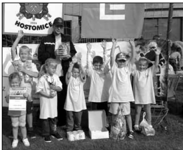
Háj příprava v Hostomicích vyhrála 1. místo