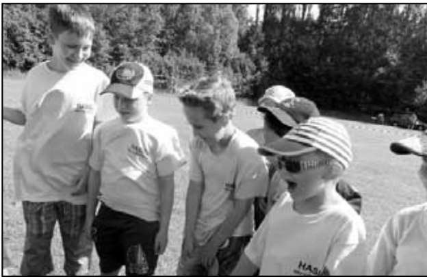
V Košťanech se děti zabavily například při obdivování techniky