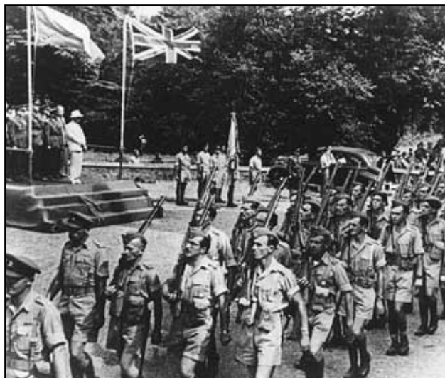
Vojáci od Tobruku