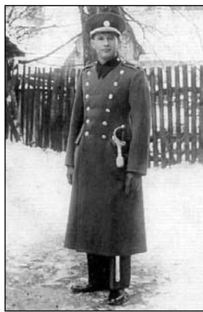
Četníci v zimním stejnokroji s pláštěm (30. léta 20. století)

Obrázky použity z publikace: Pavel MACEK - Lubomír UHLÍŘ, Dějiny policie a četnictva II., československá republika (1918-1939), Praha 1999.