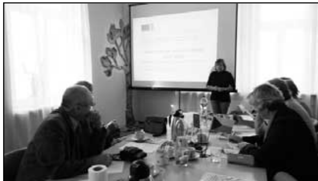
Informační akce pro management místní akční skupiny a členy místního partnerství MAS Čínovecko o.p.s. v Dubí

000 Kč na realizaci svého projektu, který nazvala „Města a obce severního Krušnohoří spolu s místními podnikateli táhnou za jeden provaz“. Získané finanční prostředky budou využity pro získávání dovedností a zkušeností za účelem vytvoření aktivního místního partnerství zabývajícího se udržitel- (Pokračování na následující straně)