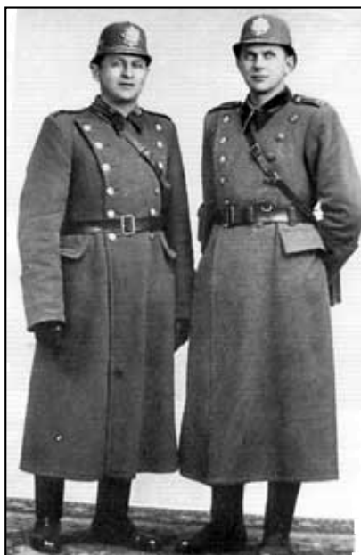
Četníci v zimním stejnokroji s pláštěm (30. léta 20. století)

Příslušníci četnické stanice Dolní Háj vedli pravidelné záznamy shmutí jednotlivých let v době fungování zmíněné stanice (tedy mezi lety 1925-1935). Máme tak možnost nahlédnout, jak četníci celkově hodnotí jednotlivé roky a to po stránce ekonomické, sociální či meteorologické. Podíváme-li se na politické postřehy četníků, tak bezesporu zajímavá poznámka je z roku 1933, kdy četníci poznamenali, že vzhledem k nastolení hitlerovské vlády v Německu se přiostrily poměry v pohraničí, takže i turistický a cizinecký ruch byl značně omezen. Prozkoumáme-li otázku nezaměstnanosti, tak výraznější projevy jsou sledovány od roku 1931, kdy během tohoto roku panovala značná hospodářská krize vesměs ve všech odvětvích průmyslu, takže nezaměstnaní dělníci se stále množili a nespokojenost obyvatelstva se stupňovala, což se projevovalo především na vysokém počtu stávek a demonstrací homíků. Nezaměstnanost byla nejvíce pociťována v zimě, a proto byli nezaměstnaní podporováni státem a obcemi. Situace se ještě více vyhroutil v následujícím roce, kdy nezaměstnanosti stále přibývalo i navzdory stavebnímu ruchu v letních měsících. Následkem této neza- (Pokračování na následující straně)