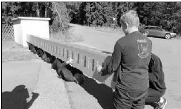
Družstvo z Háje staví stěnu z beden - jde o sílu a o spolupráci družstva!

Trénování na soutěž bylo nelehké díky řadě komplikací a změnám ve složení týmu na poslední chvíli. I tak jsme ale se snažili, za daných okolností, připravit se co nejlépe to šlo,