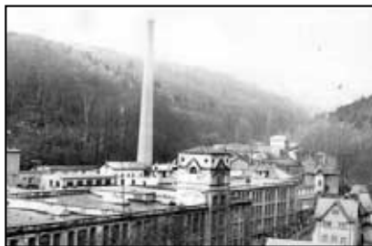
Bývalý závod BONEX s.p. Teplice, přádelna - závod 5 Mlýny

Letos se chceme pokusit o vzájemné setkání všech bývalých zaměstnanců těchto závodů dne 19. října 2013 od 15:00 hodin v restauraci Beseda v Hrobě. K naší zábavě přispěje trampská kapela „Dědkové z Kentucky“. Srdečně Vás zvou organizátoři celé akce!