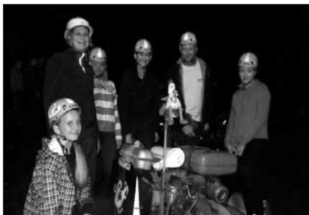
Háj ženy na Nočních závodech v Těchlovicích

znát. I přesto se náš tým z celkových devíti družstev umístil na krásném a úžasném 4. místě (Háj muži) . Po závodech někteří naši závodníci ještě spěchali například na fotbalový zápas, jiní zase domů učit se na státní závěrečné zkoušky a další zase oslavovali náš úspěch.