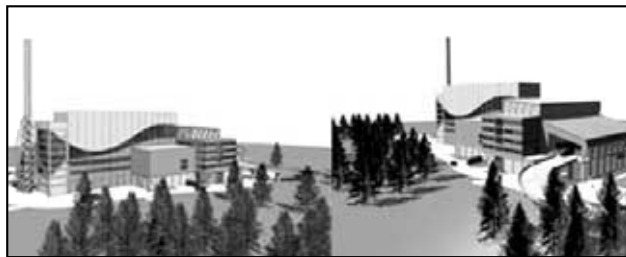
Vizualizace EVO Komořany

k získání energie polovina KO dosud mířícího na skládky. V současné době žádá investor o stavební povolení pro stavbu zařízení.