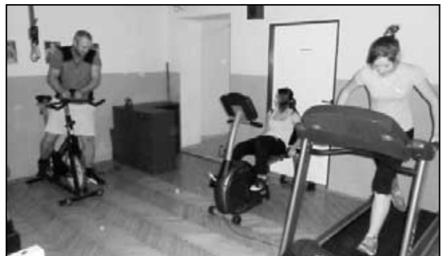
Hasiči Háj v posilovně rozhodně nezahálají.

postaveny 2 týmy, avšak jeden tým byl z části Háje, Duchcova a Obrnic. Tak tomuto společnému týmu byla opět vymyšlena originální přezdívka Obrovská DUHA (Obrnice + Duchcov + Háj), což jistě značí přátelské prostředí mezi jednotlivými sbory. A jako poslední tým starších opět ukázal svůj stoický klid. V kategorii přípravka s Háj umístil na 2. místě (1. Obrnice, 3. Osek). Háj a Obrnice v této kategorii dosáhli stejného počtu trestných bodů na trase a stejného času běhu trati. Týmu z Obrnic k výhře však pomohla 1 čekací minuta, která náš tým z Háje odsunula na 2. místo. I tak jsme byli s výsledkem velmi spokojeni a na děti pyšní. V kategorii mladší ze 16ti družstev (!) Háj získal 10. místo a Obrovská DUHA (Háj+Obrnice+Duchcov) 11. místo . V poslední starší kategorii z celkových 15ti družstev (!) Háj získal 2. místo (1. Braňany, 3. Domoušice). S výsledky závodů jsme byli spokojeni a je to dobrý začátek do no-