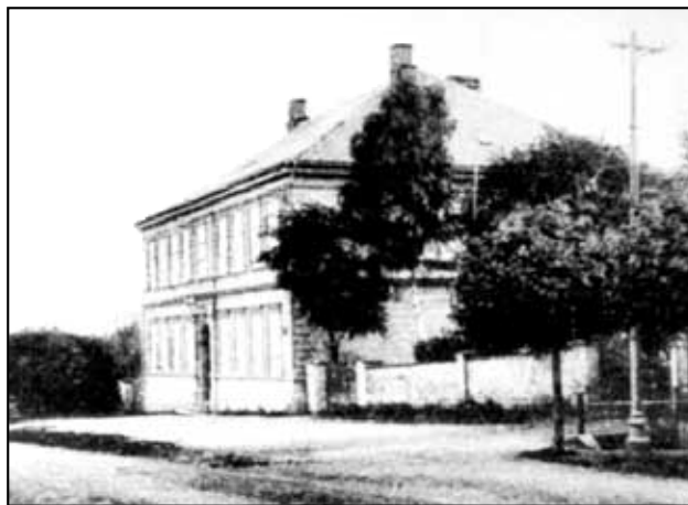
Foto školy z roku 1916.

Dnem 1. září 1980 Okresní školský úřad zrušil z ekonomických a provozních důvodů vyučování v základní škole v Háji. Všechny děti tak od