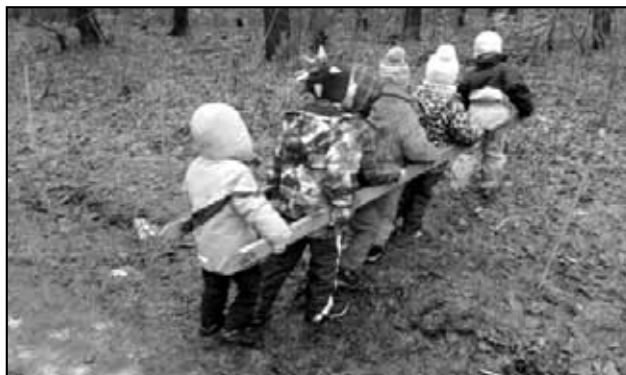
Přípravka Háj v Oseku na Nelsonských závodech provádí kličkování se žebříkem.

Dne 8. ledna 2013 ve 13:57 byl ohlášen požár činžovního domu Kubátova č. p. 40 v Hájí u Duchcova. Zásahová jednotka obce Háj u Duchcova se na místo požáru dostavila ve 14:10 v pořadí 4. zasahovací jednotky. Na místě již zasahovaly jednotky profesionálních a dobrovolných hasičů z Teplic, Duchcova a Oseka, celkem zde bylo přítomno 7 hasičských vozů. V době příjezdu naší jednotky byl již požár téměř uhašen, a tak naše jednotka začala vykonávat dohašovací práce, přičemž byla určena jako záloha s vodou. Požár propukl v bytě v prvním patře třípatrového činžovního domu. V bytě, kde požár propukl, již skoro rok nikdo nežil. Hořelo především vnitřní vybavení bytu. V samotném činžovním domě dosud bydlela pouze jedna nájemnice a ostatní byty byly prázdné.