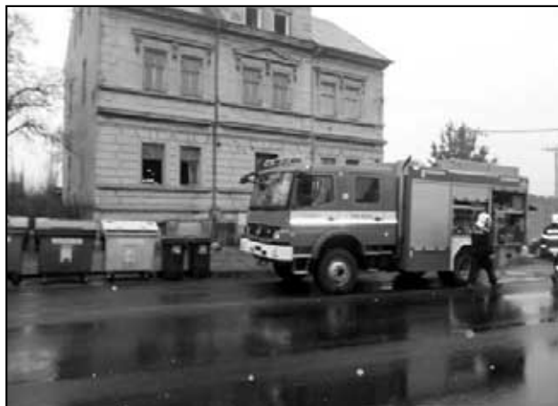
Požár v činžovním domě v Hájí u Duchcova.