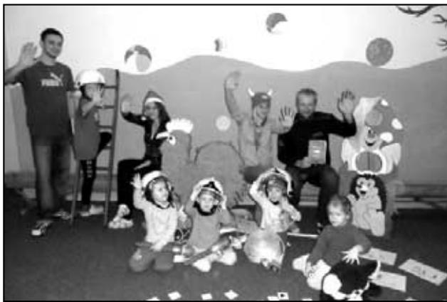
Hasiči Háj (přípravka) posílali na Vánoce pozdravy.

I přes řádící chřipku se nám podařilo postavit téměř 4 týmy, což už samo o sobě byl úspěch. Letos jsme měli štěstí a zima nebyla tak tvrdá, jako v jiných letech, avšak místo toho nám závod znepríjemnil déšť, který trasu dost rozbahnil, takže občas to místo běhu vypadalo spíše jako přeskokování kaluží. Na závod se dlouho připravoval a také těšil tým z přípravky, který ještě před pár měsíci byl týmem „nováčků“. Avšak na závodech tento tým ukázal, že se mezi nováčky už neřadí, ba naopak že se jeho členové považují za profesionály právem konkurující svým soupeřům. Naproti tomu tým mladších žáků, který letos přešel z kategorie příprava postupně zjistil, že v nové kategorii je čeká řada těžkých soupeřů a že vítězství určitě nedostanou zadarmo. V kategorii mladší byly