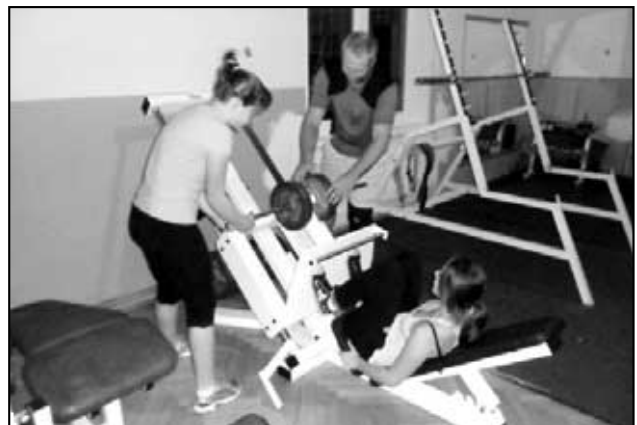
Hasiči Háj v posilovně v Oseku U Zenkyho.