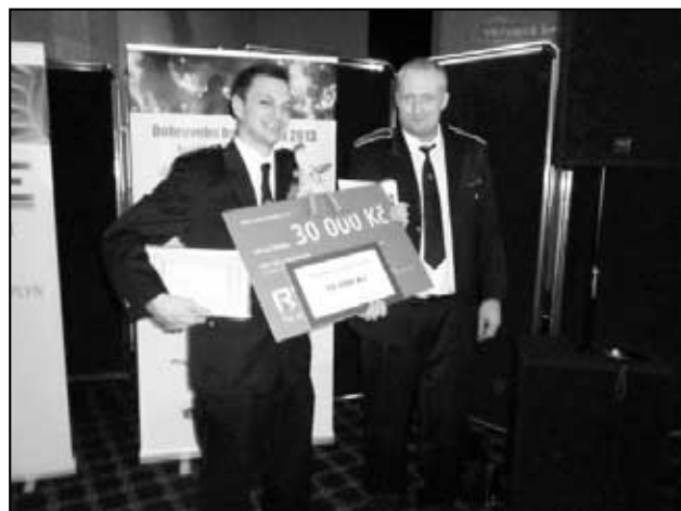
Zástupci SDH Háj u Duchcova na slavnostním galavečeru v Brně