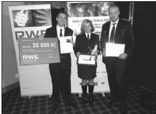
1. místo Háj u Duchcova v soutěži Dobrovolní hasiči roku 2013 v kategorii sbory a v oblasti sever-střed Čech