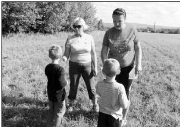
Mladí hasiči nelítostně zkouší a prověřují soutěžní týmy ze znalosti požární ochrany