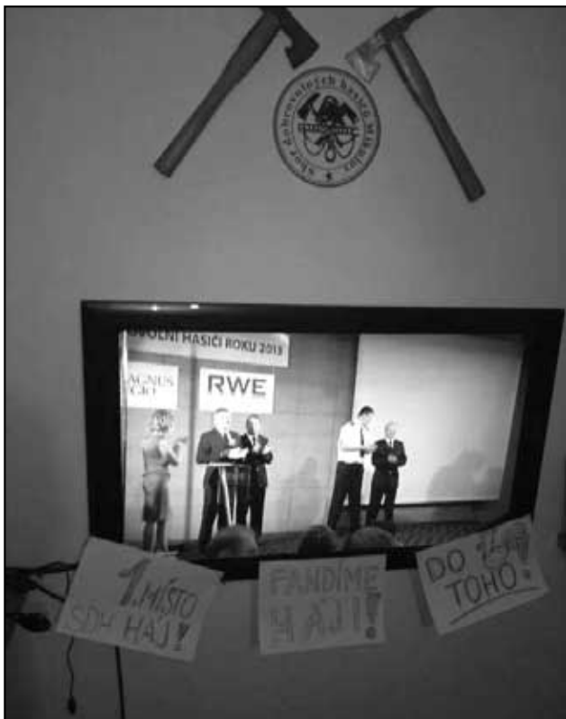
Mnozí přátelé a kamarádi fandili doma u obrazovek, jako na příklad přátelé z Mikulova

sbor odborná porota vybere do finále. Nevěděli jsme nic o našich soupeřích ani o jejich akcích, které přihlásili.