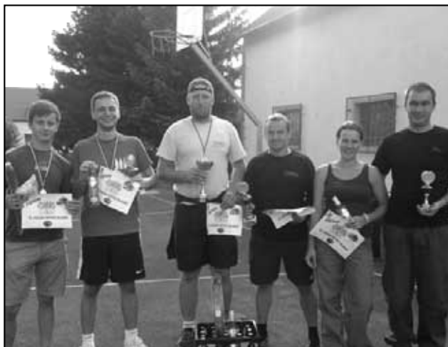
První tři místa na Bitvě klanů patřila domácím družstvům

14. září Osek - 3. ročník Tondův soptík - těchto závodů se zúčastňují pouze a jen závodníci v kategorii přípravka, pro