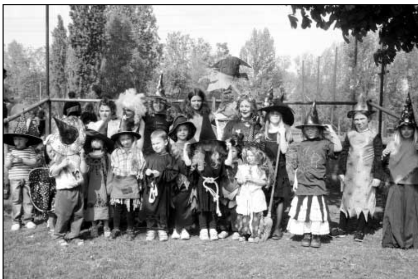
Účastnice a účastníci čarodějnického sletu.

O soutěže pro malé čarodějky a čaroděje se postaral dramatický kroužek Škrpál Základní umělecké školy v Litvínově. Rodičům příjemně hráli J + J. Na večer se přešlo k symbolickému upále-