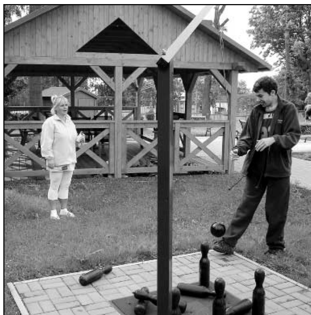
Dětského dne se klienti z ÚSP Háj nabažili opravdu do syta.