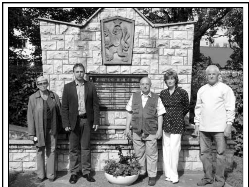
Zastupitelé a členové Kulturní a sportovní komise obce položili ke Dni vítězství kytky k pomníku padlým a umučeným hájským občanům.