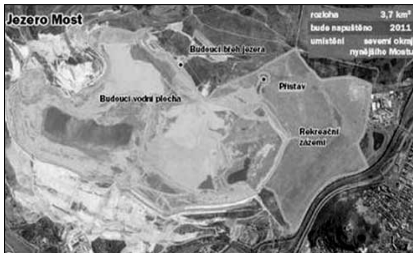
Výhledový plán mosteckého jezera

jezírko. Veřejnost zatím k jezeru až do odvolání zákazu vstupu z bezpečnostních důvodů nesmí. V další etapě má vzniknout u jezera atraktivní rekreační