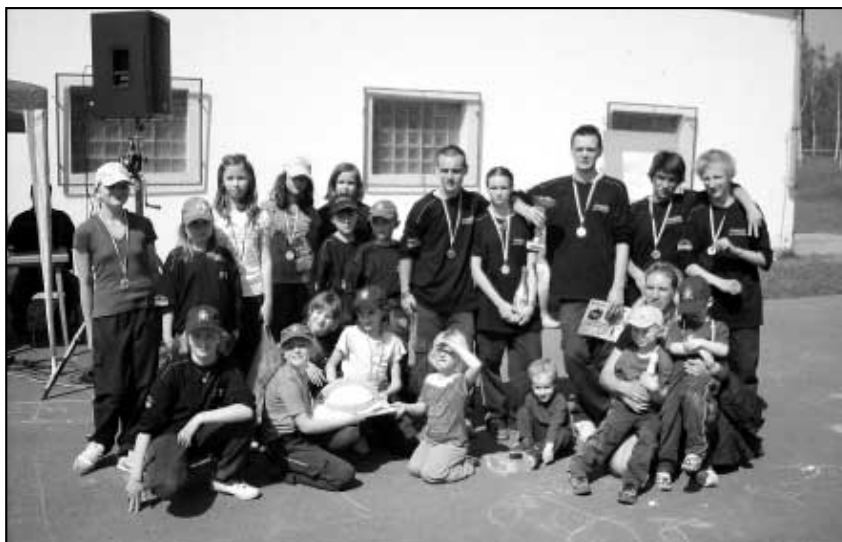
Vítězná družstva soutěže O pohár starosty obce Háj u Duchcova.