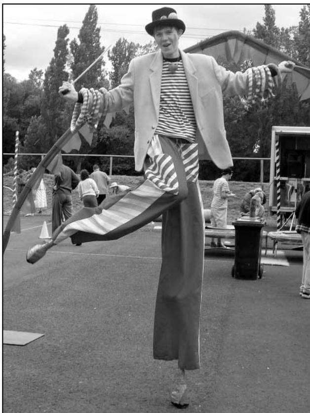
Dětský den přinesl opravdu vyžití!

S mích, radost, hudba, spousta atrakcí, sladkostí a sluníčko - to patří k oslavám Dne dětí, které se za velké účasti dětí i dospělých konaly v neděli 7. 6. 2009 v prostorách hájského fotbalového hřiště. Všechna lákadla děti využily v plné míře s radostí jim vlastní. Od tradičních atrakcí, jako je skákač gumový hrad, kde se metala salta a kotrmelce, až k novinkám typu moucha: tuto velice zábavnou nafukovací atrakci, jejímž principem je ve speciálním obleku vylézt jako moucha po zdi na vrchol, mohly děti zdolávat hlavou nahoru či dolů. Vše záleželo na jejich šikovnosti, jakou má jen „moucha“.