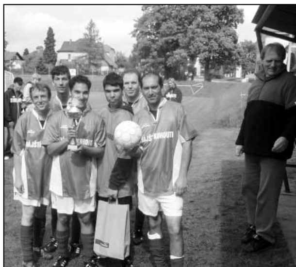
Družstvo z ÚSP Háj patřilo na fotbalovém utkání v Lidmaní u Pelhřimova k nejlepším.