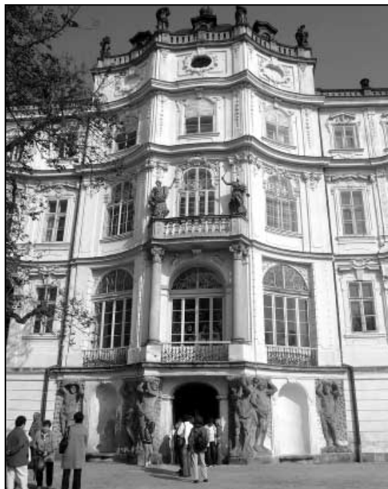
Ploskovice, zámek z 18. století, sloužil také jako letní sídlo Edvarda Beneše.

vodci srozumitelně vykládali historii zámku, přibližovali jeho architektonický vývoj, seznamovali se střídaním majitelů a v neposlední řadě pohovořili o funkcích zámku během jeho poměrně krátké existence (zámek byl postaven v 18. století, sloužil především jako letní sídlo šlechtických majitelů, ale také prvorepublikového ministra zahraničních věcí Edvarda Beneše; za nacistické okupace zde sídlila NAPOLA - nacionálně politická škola). Po prohlídce interiérů se přešlo ven do zadní části zahrady, kde se nachází vstup do umělých jeskyň, tzv. grott. I zde byl návštěvníkům představen vznik a význam těchto netradičních prostor. Samotná prohlídka zámku a jeho zahrad však neznamovala konec výletu. Přímo ve vestibulu zámku totiž probíhala velikonoční výstava s možností zakoupení různých svátečních ozdob. Výtvorů zde bylo přehršle, takže každý si vybral ten svůj: kraslice, ozdoby do květináčů, ke-