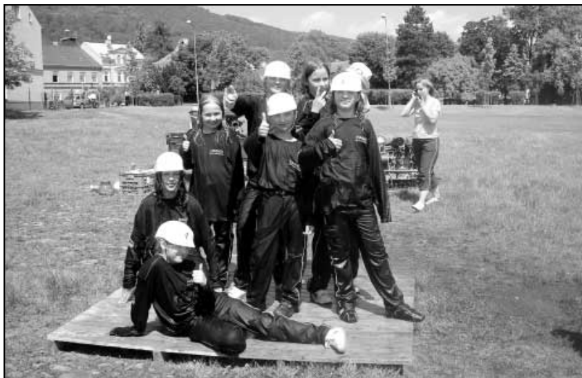
Hájští jako vítězové Osecké stříkačky.

Nejprve se závodilo v jednotlivcích na štafetě, kde měl každý dva pokusy. Hájským se vedlo velmi dobře a měli z toho dobrý pocit do další etapy soutěže. Trochu však nestíhali trenéři motat a připravovat znovu, znovu a znovu (Pokračování na následující straně)