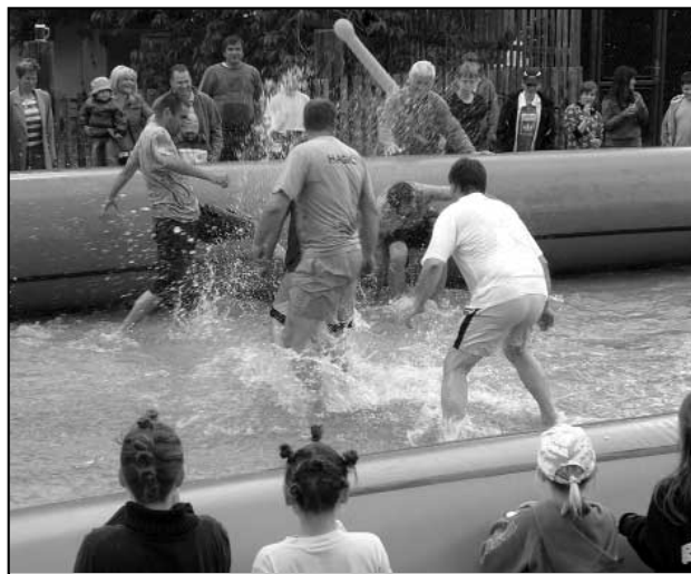
... A nejen pro děti!