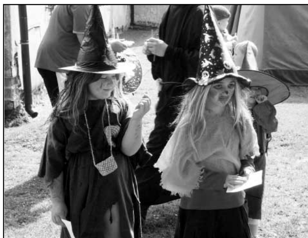
Kolegyně čarodějky se při soutěžích snažily, aby obstály v kouzlení.