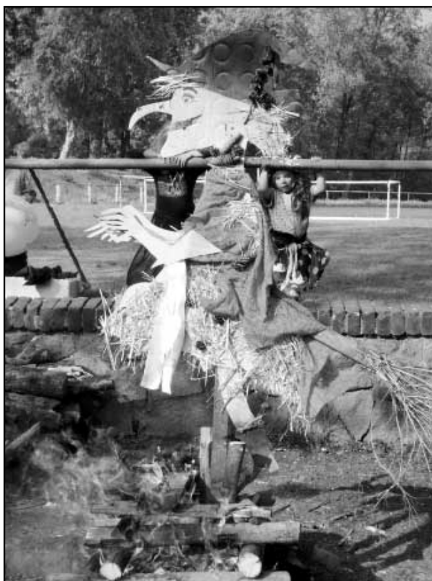
Symbolická čarodějnice vzplála a slet 2009 byl ukončen.

ny se tančilo nejprve na country šlágrů Dědků z Kentucky, poté se přitvrdilo s rockovou kapelou B.A.R. a končilo se rozjařenou diskotékou. (rr)