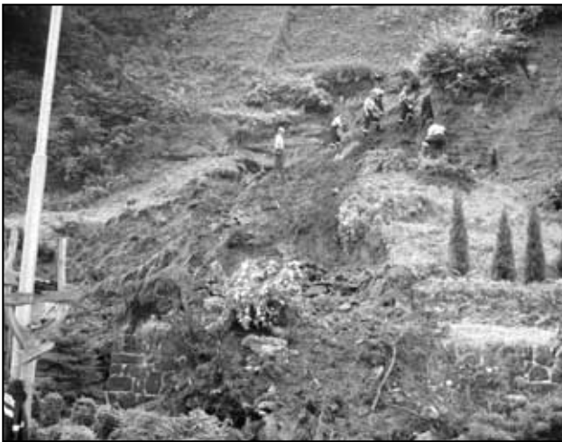
Práce na svahu u obchodu HUDYsport ve Hřensku.

nad očekávání velmi rychle díky dvěma motorovým pilám, které si hasiči z Háje přivezli, a také díky pomoci hasičů z Mikulova. Do oběda hasiči odstranili nejzávažnější překážky, které byli schopni odstranit, a proto se po konzultaci s operačním střediskem v Děčíně rozhodli přemístit do daleko postiženější obce Hřensko.