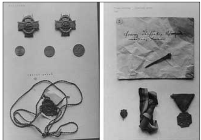
obálka bez jména s obecní pečetí