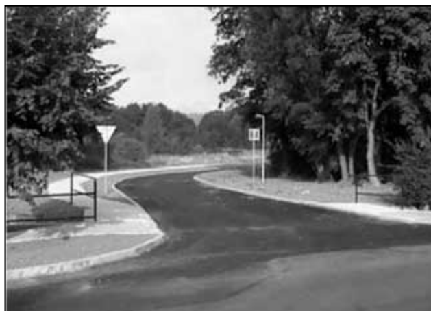
Dnešní situace místa kde stával pomník křižovatka ulice Kubátova a ulice Ke Knížáku