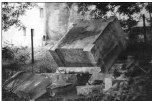
Torzo zrušeného pomníku, pod kterým bylo uloženo pouzdro