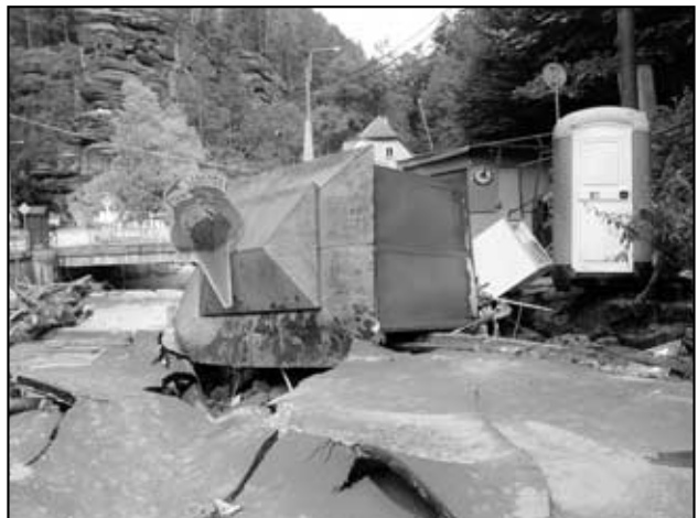
Bývalý stánek se zmrzlinou ve Hřensku.