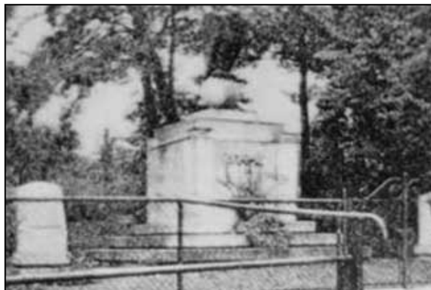
Původní pomník mezi čp. 96 a čp. 97

tově ulici mezi čp. 125 a čp. 132, dle rady MNV na důstojnějším místě. Nový pomník byl odhalen v květnu 1975 k 30. výročí osvobození vlasti sovětskou armádou. Zbytky původního pomníku z r. 1926 byly odklizeny. Pískovcový monolit je uložen na dětském hřišti. V základech pomníku byla mladými požárníky nalezena tuba s písemností a upomínkovými předměty, které jsou uloženy v teplickém muzeu.