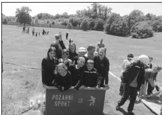
Starší tým na Osecké stříkačce skončil v nádrži s vodou.