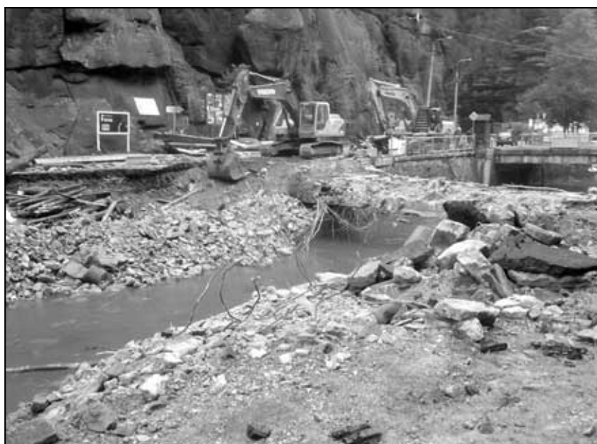
Jeden ze dvou mostů ve Hřensku u soutěsek byl zcela zdemolován vodou.