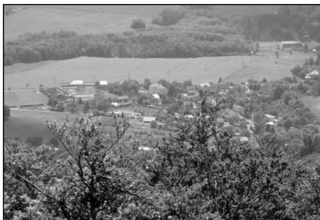
Vesnička pod horami. Poznáváte?