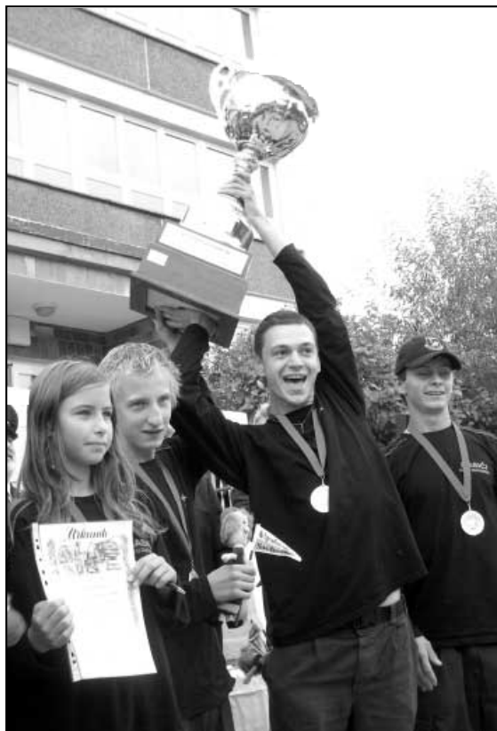
Přebírání putovního poháru