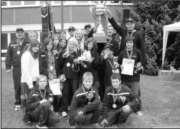
Vítězná fotka, Hájské týmy v Německu