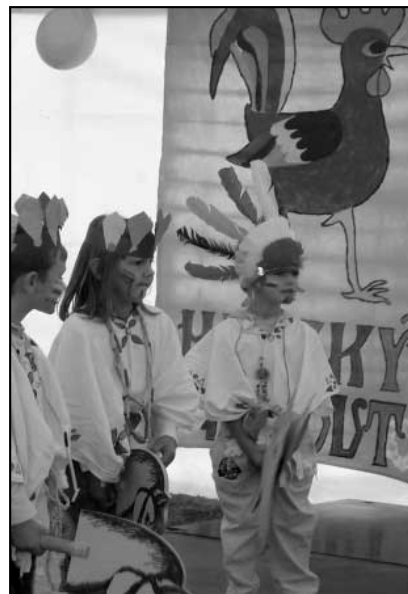
Hájští kohouti při vystoupení na stejnojmenné soutěži