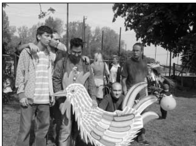
Přišli zahrát i Hájšťí kohouti.