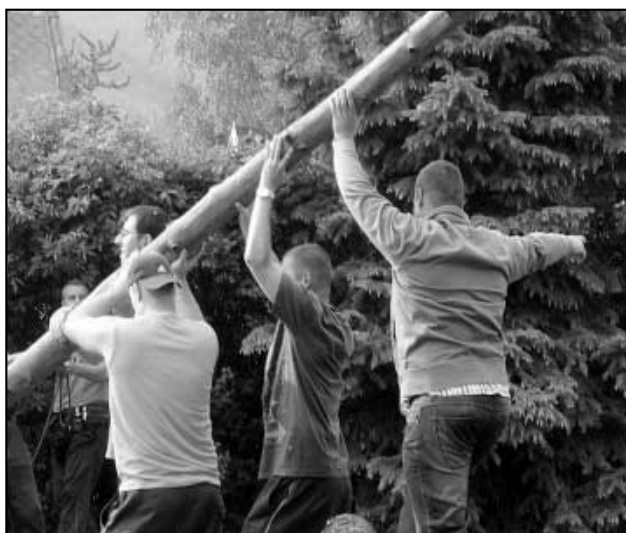
Ještě vztyčit májku!

Za pomoci silných paží se věc podařila a máj, lásky čas, může začít. ►