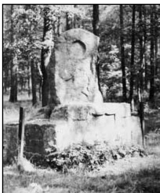
Původní pomník Karla Marxe v lesním prostoru.