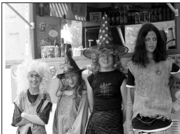
Čarodějné kvarteto vsutku kouzelné