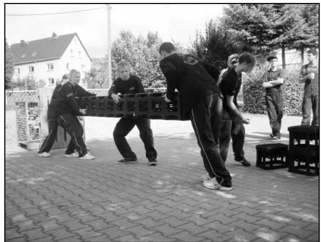
Stavění beden, Háj I

Po ukončení závodu začala očekávaná nervozita a tipování výsledků. Po zbytek dne byla ukázkou slaňování budov německých kolegů a každý se mohl zabavit na hřišti, kde se třeba hrál i mezinárodní fotbal. Na večer všichni hasiči odjeli společně do plaveckého bazénu k odreagování. Tato akce se všem hrozně líbila, úplně každý se tam vyřádil. Děti daly dost zabrat dospělému dozoru, který sotva držel s nimi krok v různých hrách. Poslední den už všichni horlivě čekali na výsledky a sledovali, jak se vše připravuje na konečný nástup. Při vyhlášení výsledků byl každý tým zasypán bouřlivým potleskem a také každý člen dostal medaili. Náš tým zachvátila obrovská nervozita. Aby v Německu vyhrál