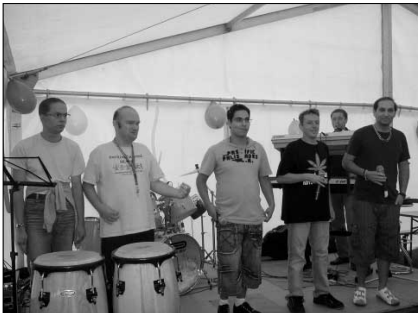
Indiáni - hosté z MŠ Košťany

kovatelná atmosféra - zpěv, recitace, tanec, radost z pohybu, radost z blízkosti kamaráda. Jako host jsem se této akce za Kulturní a sportovní komisi naší obce účastnila poprvé. Protože jsem léta s dětmi pracovala, vím, co to je připravit a nacvičit kulturní program, kolik je za každým vystoupením úsilí, času a námahy. Proto oceňuji přípravu s klienty a organizaci celé soutěže. Děkuji za pozvání.