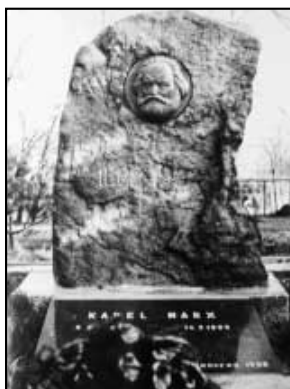
Přemístěný a obnovený pomník Karla Marxe r. 1988 v Zelenkově ulici v Háji.