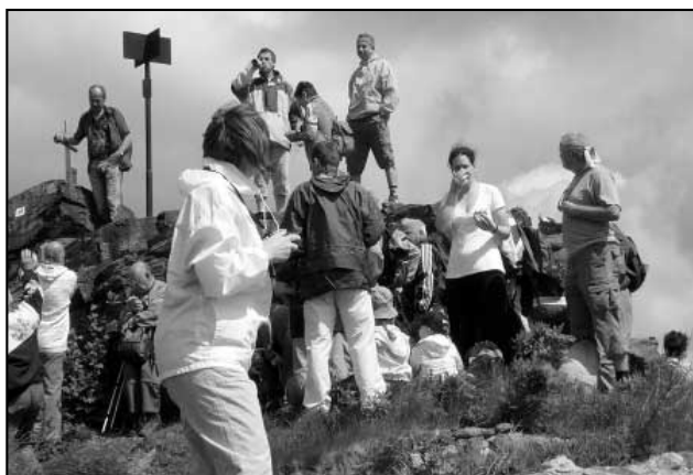
Zdolání vrcholu Stropníku, 856 m nad mořem.