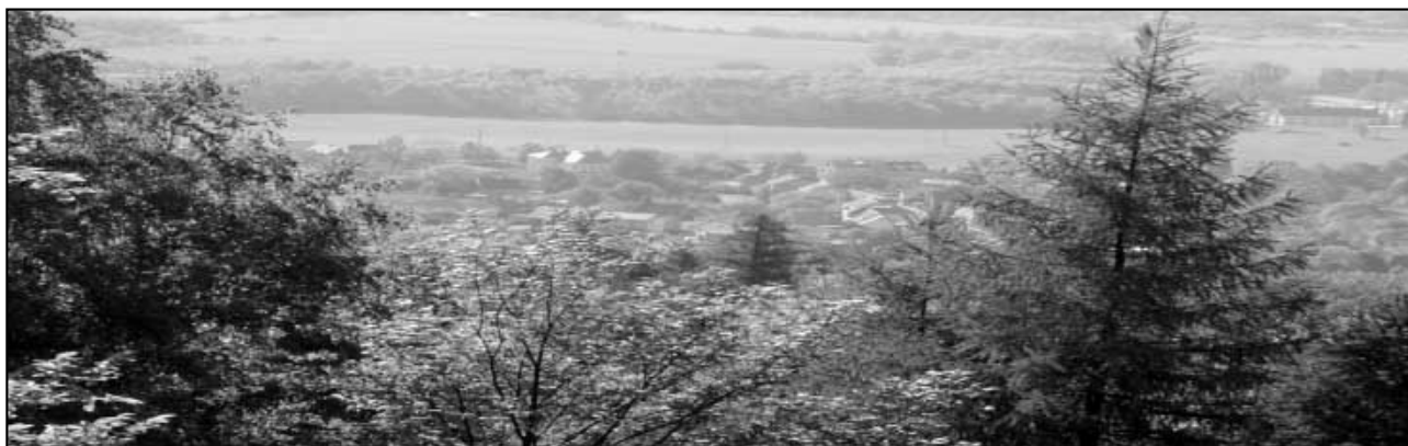
A Háj nám ležel u nohou...