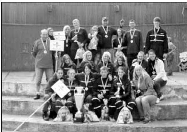
Společná fotka vítězů na Euroregionu Krušnohoří 2012 v Mostě (Bílence 1. a Háj 2.)

ji tak popřál k těmto významným narozeninám před všemi ostatními kolektivy mladých hasičů.