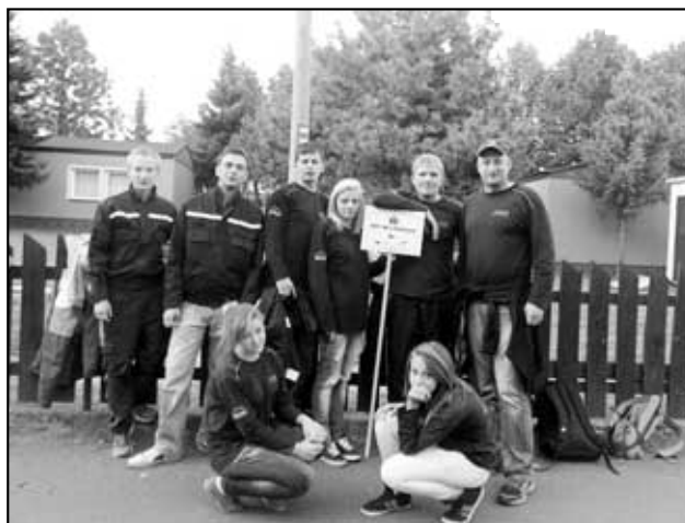
Hájský tým na Euroregionu Krušnohoří 2012 v Mostě