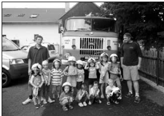
Nováčci na hasičském kroužku - při prohlídce hasičárny si zkoušeli také přilby