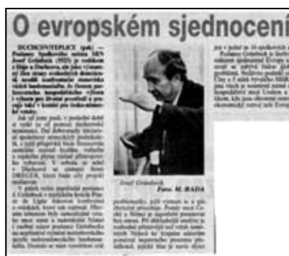
O evropském sjednocení