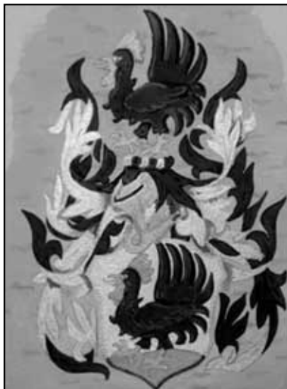
Rekonstrukce erbu podle autora článku

1) V době, kdy vznikl, mělo znak o dost méně měst, a to povětšinou královských; poddanským městům byly znaky udělovány podstatně méně a u vesnic to bylo něco zcela zvláštního.