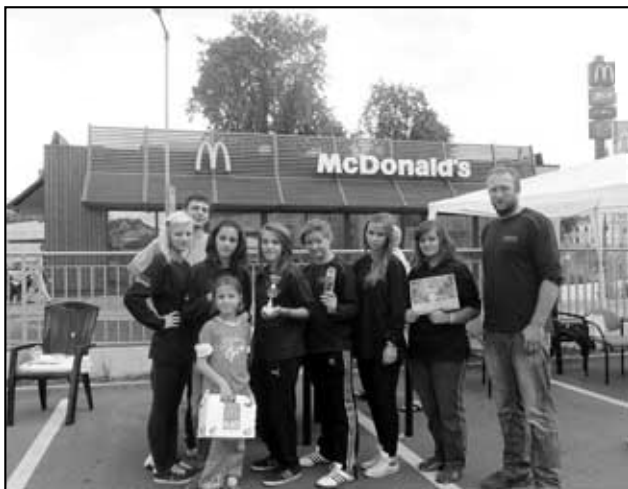
Háj starší na závodech v Teplicích u McDonaldu

kož obě družstva nemají dostatek závodníků na ukončení hry (je potřeba 9 závodníků), tak se rozhodli spojit. Spojením tak stoupla šance na postup do krajského kola, ve který oba dva týmy doufají. Přátelská atmosféra žádnému týmu nechybí a všichni se těší na společnou spolupráci a na trénování. Háj