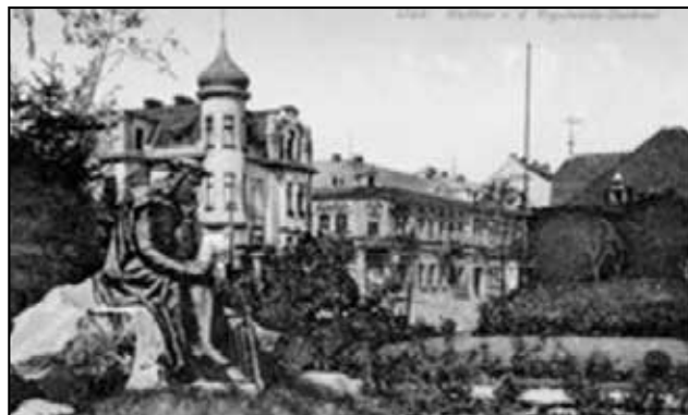
Obnovení sochy německy píšícího lyrického básníka a největší postavy německého minisengra Waltera von Vogelweite v parku Obránců míru v Duchcově