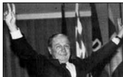
Jeho vítězný postoj ve volbách do Bundestagu v r. 1989