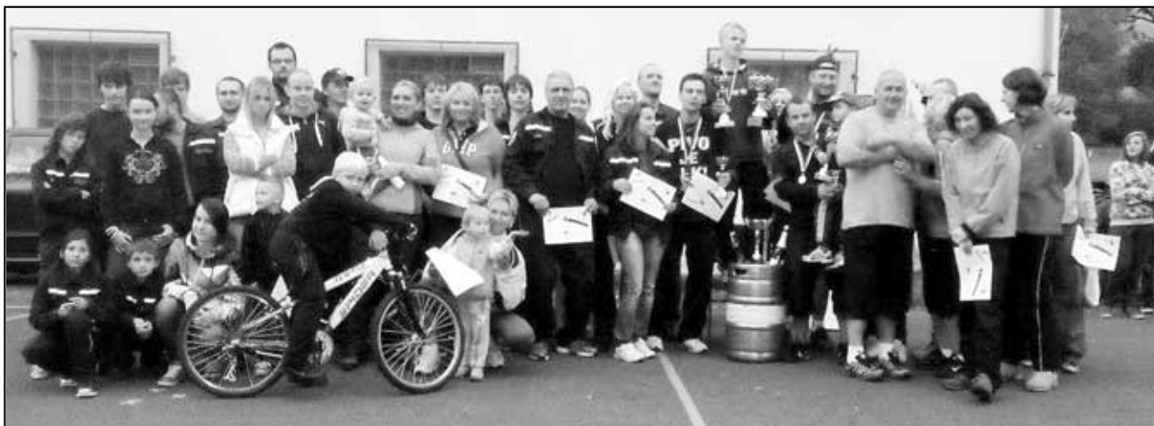
Společné foto na 8. ročníku Bitvy klanů v Háji u Duchcova 29.9.2012 - letos se zapojila i široká veřejnost pod motem Vyzkoušejte si, jaké je to být hasičem