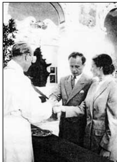
Při sňatku v kostele Weis-Kirche v r. 1952

ny - Grünbeck Wasseraufbereitung GmbH - o pěti stech zaměstnancích. Jeho motem bylo - „ Voda je naše pivo “! V 50. letech byl vyznamenán plakétou Bavorského sportovního sdružení, neboť se vedle podnikání pravidelně věnoval také sportu.