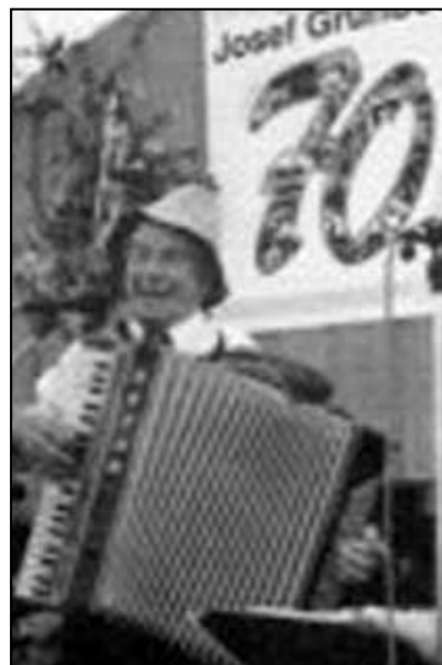
Při oslavě svých narozenin v roce 1995