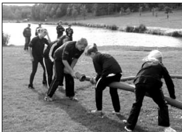
Jedna z disciplín na Euroregionu Krušnohoří - stáčení savic do kruhu je měřeno na čas - je to týmová disciplína