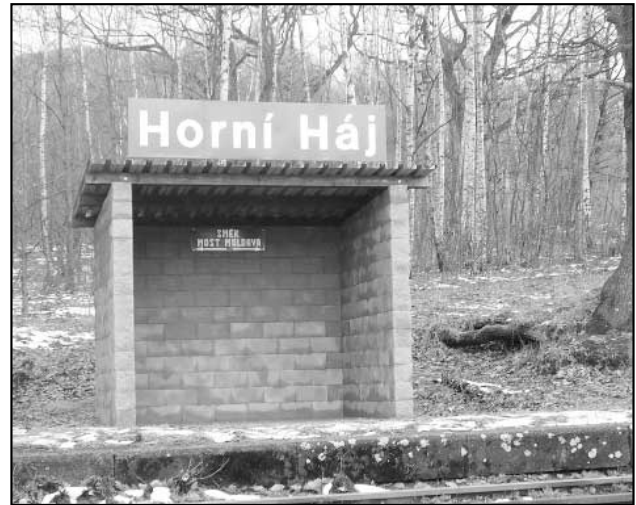
Čekárna v nové podobě již dnes slouží všem cestujícím.