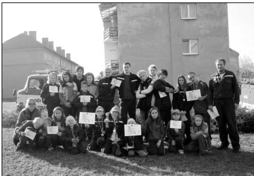
Sbor mladých dobrovolných hasičů z Háje a jejich trenérů.