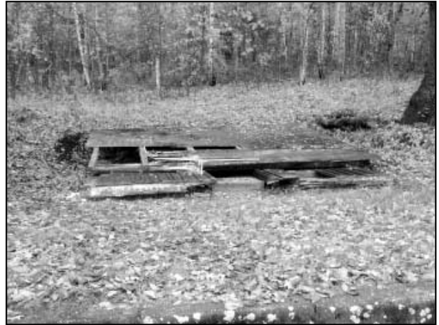
Díváte se na rozbořenou vlakovou čekárnu v horním Háji. Na její nevyhovující stav bylo upozorněno v minulém čísle zpravodaje.