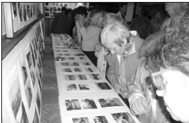
Výstava se pro návštěvníky stala vzpomínkovou exkurzí do let minulých. Připomínalo jim to i motto celé výstavy: „ Minulost nemůžeme vrátit, proto si ji připomeňme! “