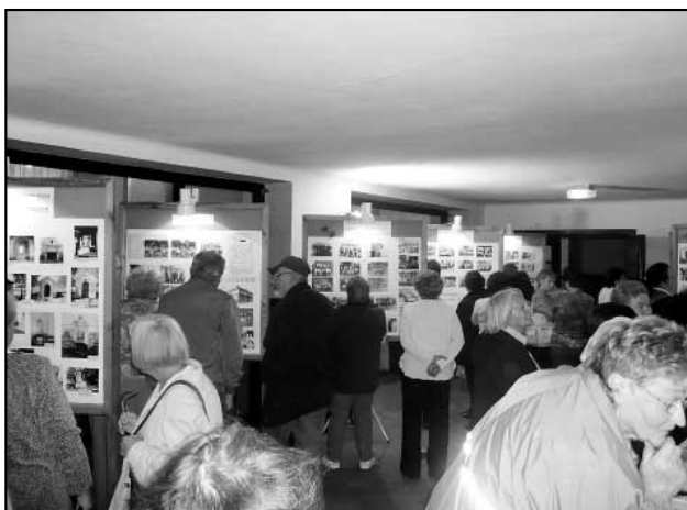
Velké expoziční panely byly obklopeny zvědavými očima. Fotografie se zhotovily ve větším formátu, aby všem přinesly jasný obraz a nic neuniklo.