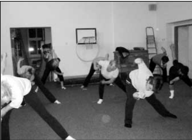
Každé úterý od 17:30 do 18:30 v tělocvičně školky protahují svá těla ženy a dívky různého věku. Zájem o cvičení neochladl ani po prázdninové odmlce.